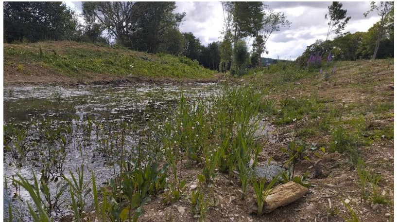
Repousse spontanée de végétation de milieux humides 4 mois après les terrassements

Une partie du site, seulement, sera accessible pour préserver la quiétude de la faune.