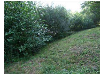
9 ans plus tard