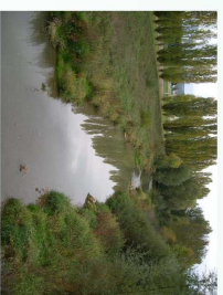
Réhabilitation d'une rivière en mi-