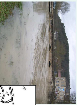
Des crues violentes

Début timide des premières actions dites innovantes : • Réhabilitation d'un cours d'eau en traversée urbaine • Aménagement d'abreuvoirs • Plantation de ripisylve