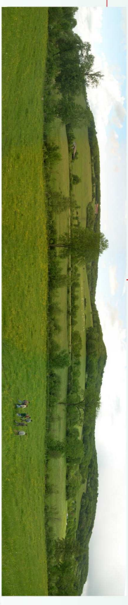
Plantation expérimentale d'une ripisylve