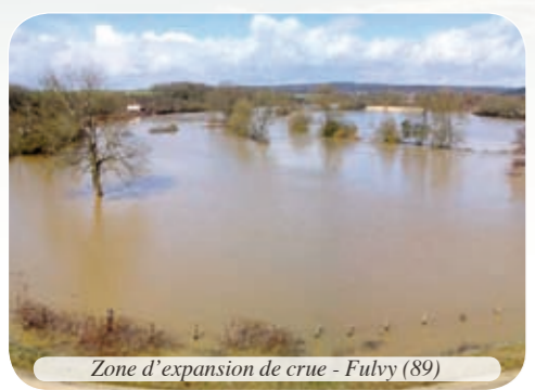
Zone d'expansion de crue - Fulvy (89)

La prise en compte des risques dans l'aménagement du territoire doit permettre de ne plus implanter de nouvelles activités ou constructions susceptibles de connaître des dommages, mais également de préserver les zones naturelles d'expansion de crues.