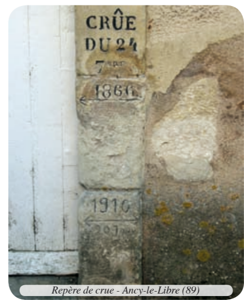
Repère de crue - Ancy-le-Libre (89)